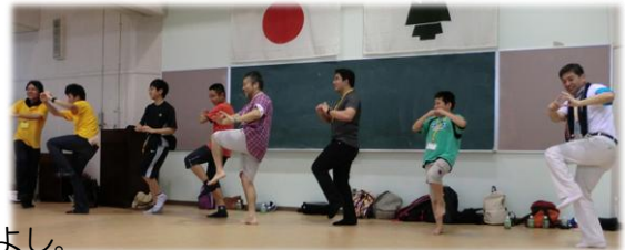
1日目 開会式後 楽しいゲーム。いっぺんに皆なかよし。