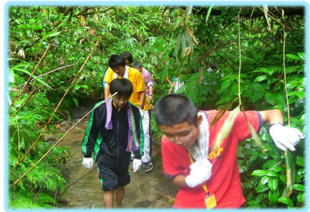
1日目 15時 雨上がり。サラサラ流れる、涼しい沢を登って自然を満喫。