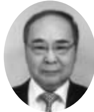
埼玉県糖尿病協会 会長