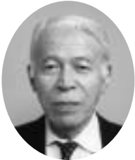
日本糖尿病協会 埼玉県支部 支部長