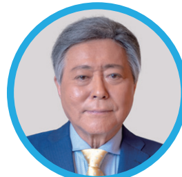
タレント 小倉 智昭 さん

8歳のときに1型糖尿病を発症。「1型糖尿病でも何にでも挑戦できる」をモットーに、4歳から始めたエアロビックでは2002年、2003年にジュニアの世界チャンピオンになる。引退後は元日本代表選手として教育機関や各種イベント等での講演や実演、運動指導などを行っている。